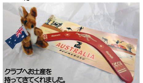
クラブへお土産を持ってきてくれました。

こんにちは 私クリスティーティンです。17歳です。私の町 マックアイはオーストラリアの中央海岸にあります。人口7万人の小さな町です。グレートバリアリーフが目の前にあり、少し行くだけで自然の真ん中に入ります。私は Whitsunday-anglican