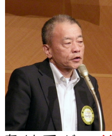
川畑会長が所見の中で、「ロータリーの原点を踏まえ、

『ロータリーとは何か』を考へながら、大須ロータリーの特長を作り、改善できる事は改善し、結果、会員拡大を重点的に行っていること、おっしゃっていました。