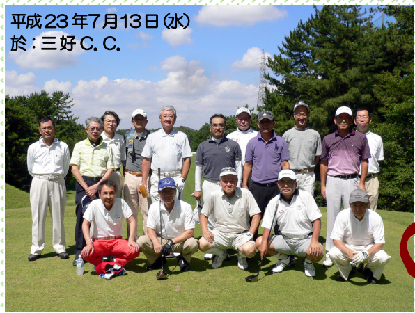
平成23年7月13日(水) 於：三好 C. C.