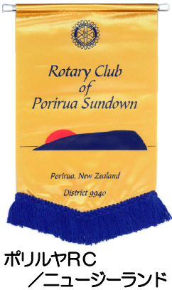
ポリリヤRC / ニューゼーランド