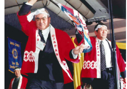
国際協議会 G.E.T.S (写真右・右) バンコク世界大会 (写真左・左) 2012