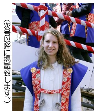
(次頁以降に掲載致します。)