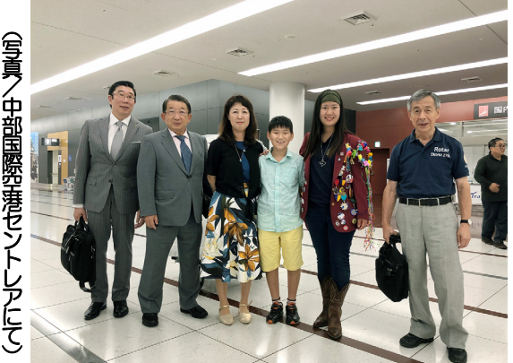
写真：中部国際空港セントレアにて

夏休みを利用してサンアントニオにある美術館や博物館めぐりはじめました。サンアントニオにはたくさん美術館や博物館がありますが、なかなか行く機会がなく、ようやく行けて嬉しかったです。