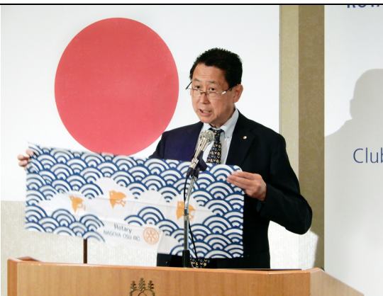
*今年度地区補助金事業「Pacific Friendship Bridge 東白川青少年大立洋交流」の記念品が完成し、会長より披露されました。

先週は入れ歯の話をしました。入れ歯は最も新しい技術だったのですが、最近はかなりインプラントに取って代わられました。入れ歯の着脱の不便さと、入れ歯のイメージが老人、老化感覚につながる、それへの嫌悪感、忌避感があるのではありません。またこの最近10年くらいで私たちの回りでもよく聞く治療法として、身近で不安感がなくなってきたのかもしれない。インプラントメーカーも世界では30社ほどあり、ほぼ毎年のように新型インプラントが発表されています。常に新しい機能とありますが、キャッチコピーが付けられています。まるで毎年発表されるゴルフのクラブのようです。ますます患者さんにとっても歯科医師にとっても、インプラントの選択が難しくなっています。そこで皆さんが将来必要になった時にどう選択したら良いのか、常識で考えるインプラントの選択方法を今日はお話しします。 まず最もよく勘違いされるのがインプラント専門の先生にやってもらいたがることです。よくインプラントの専門というたった広告を目にします。大きな交差点では最近よく見かけます。インプラントの専門医でなくいいのかわかるかもしれません。が見方を交えて考えてみましょう。一般医科の専門性は当然必要で、水虫の人が眼科には行きませ