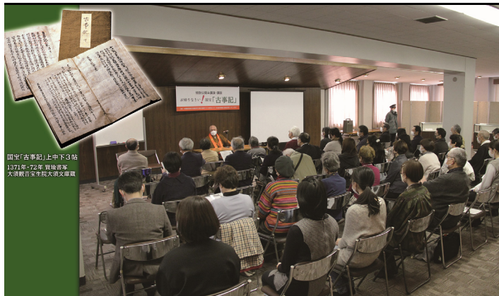
国宝「古事記」上中下3帖 1971年-72年 複製作家 大須観音養生院大須文庫蔵