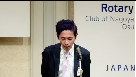
学時に名古屋に出てまいりました。その後名古屋で就職し20年以上名古屋におりました。子供が産まれた約6年前に地元の前で住宅

私は岐阜県の関市という刃物で有名な田舎で生まれ育ち、大学進学時に名古屋に出てまいりました。その後名古屋で就職し20年以上名古屋におりました。子供が産まれた約6年前に地元の前で住宅